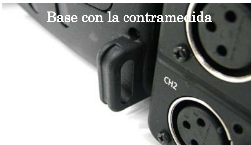
Base con la contramedida