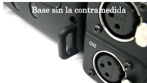
Base sin la contramedida